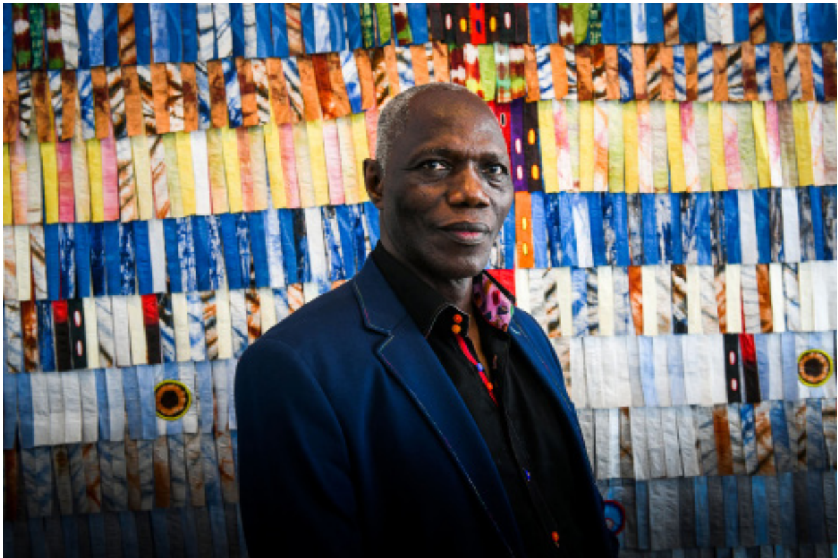
Abdoulaye Konaté en résidence artistique à Casablanca pour « Prête-moi ton rêve », août 2018.

La Fondation pour le Développement de la Culture Contemporaine Africaine (FDCCA) organise à partir du 18 juin 2019 « Prête-moi ton rêve », une grande exposition itinérante dans 6 pays d'Afrique, réunissant une trentaine d'artistes africains de renommée internationale, de 15 nationalités différentes.