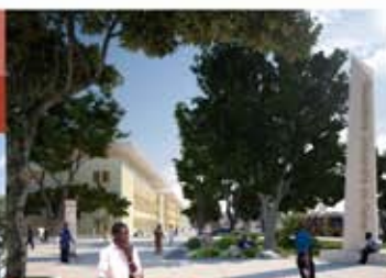
Université Amadou Moctar MBOW