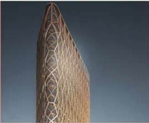
Tour de l'émersion