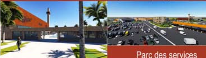
Parc des services