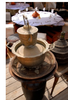
Tableau de Sable : Avec les artisans du l'espace création.

10h00 – 12h30 : Animation a l'espace Haima Enfants par Daddy-Dada & Compagnie :